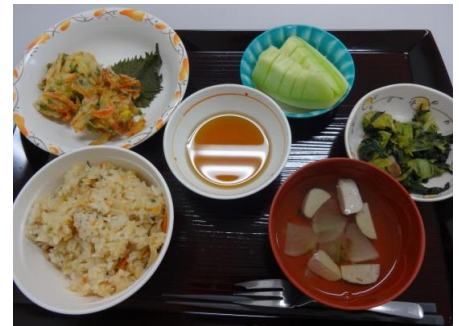
（4月1日 静岡県 郷土料理の写真です）